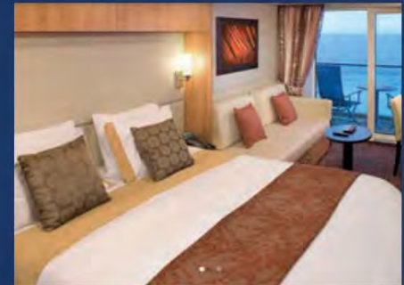
Veranda-Kabine ab 2.797,60 $ pro Person*