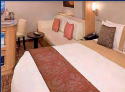
Innenkabine ab 2.384,60 $ pro Person*