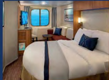
Kabine mit Meerblick ab 2.506,60 $ pro Person*